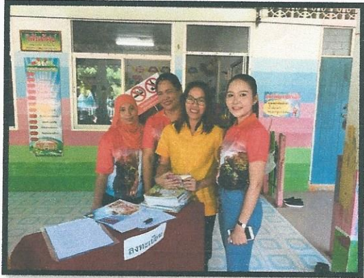
จุดลงทะเบียนคะ