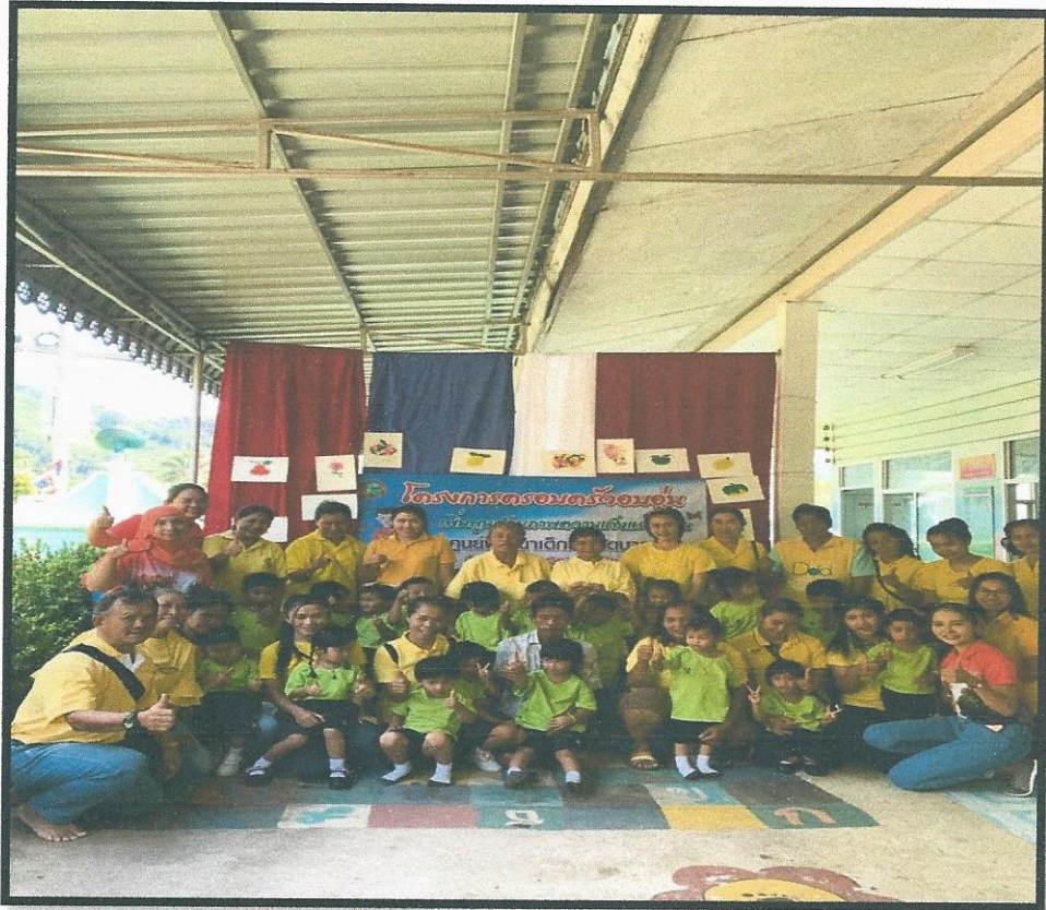
เก็บภาพความทรงจำนะคะ