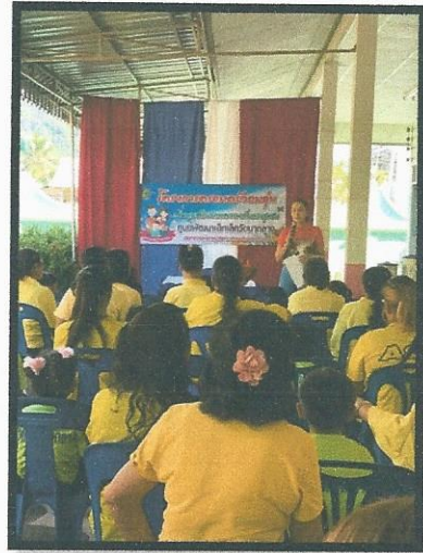
กล่าวแนะนำโครงการ