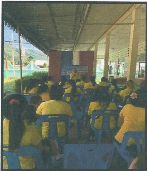
วิทยากรให้ความรู้เทคนิค การเล่านิทาน